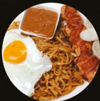
Bami speciaal met kroepoek

gambás in chilisaus gebakken rode ui, of in knoflookroomsaus