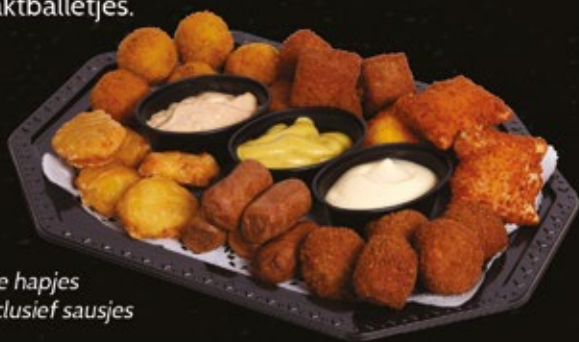
Warme hapjes zijn inclusief sausjes

Schaal warme hapjes 60 stuks 55.00 mini frikandellen, bamihapje, nasiballetjes, kaassouffletjes, bitterballen, kipnuggets, en gehakballetjes.