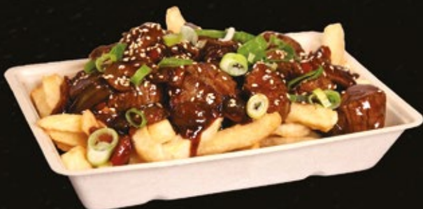
NIEUW BEEF TERIYAKI